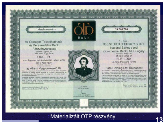
Materializált OTP részvény