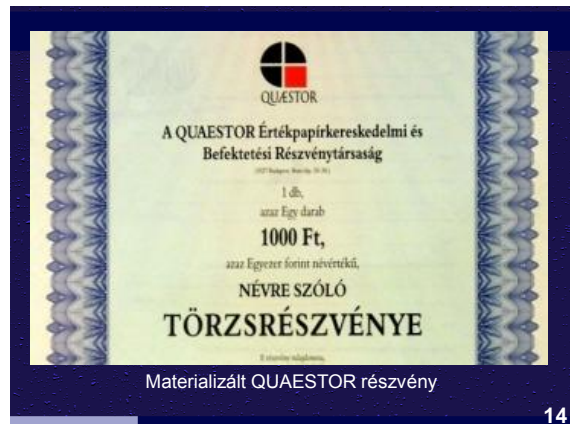
Materializált QUAESTOR részvény